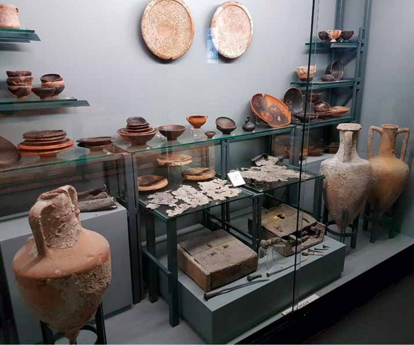
Vrakfynd från Grand Congloué på Musée des Docks Romains i Marseille.