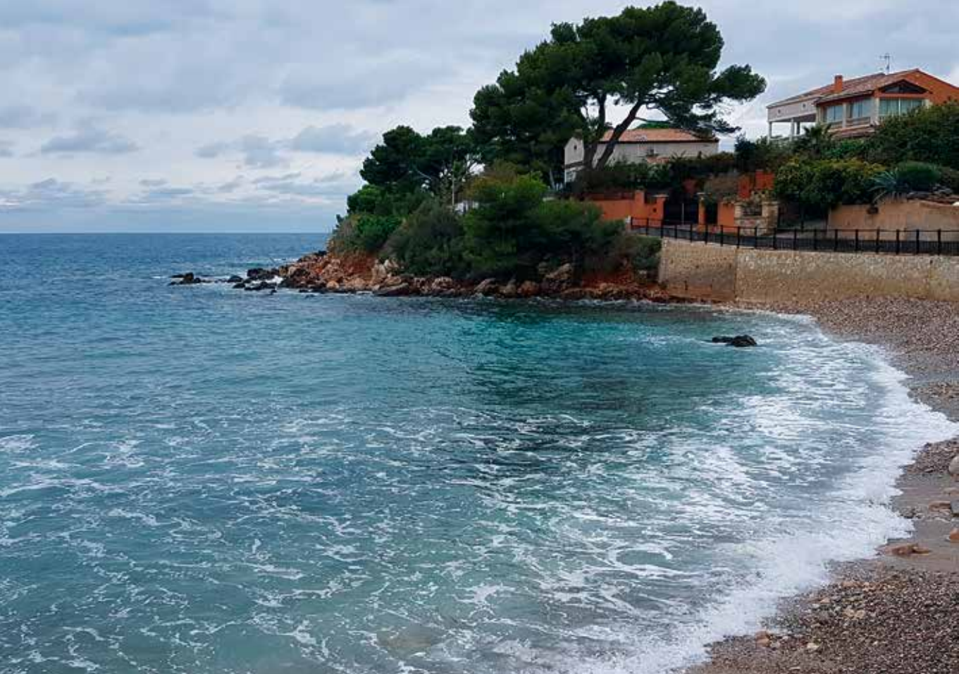
Plage de Barry, Bandol, där det första provdyket med "aqualungan" ägde rum.