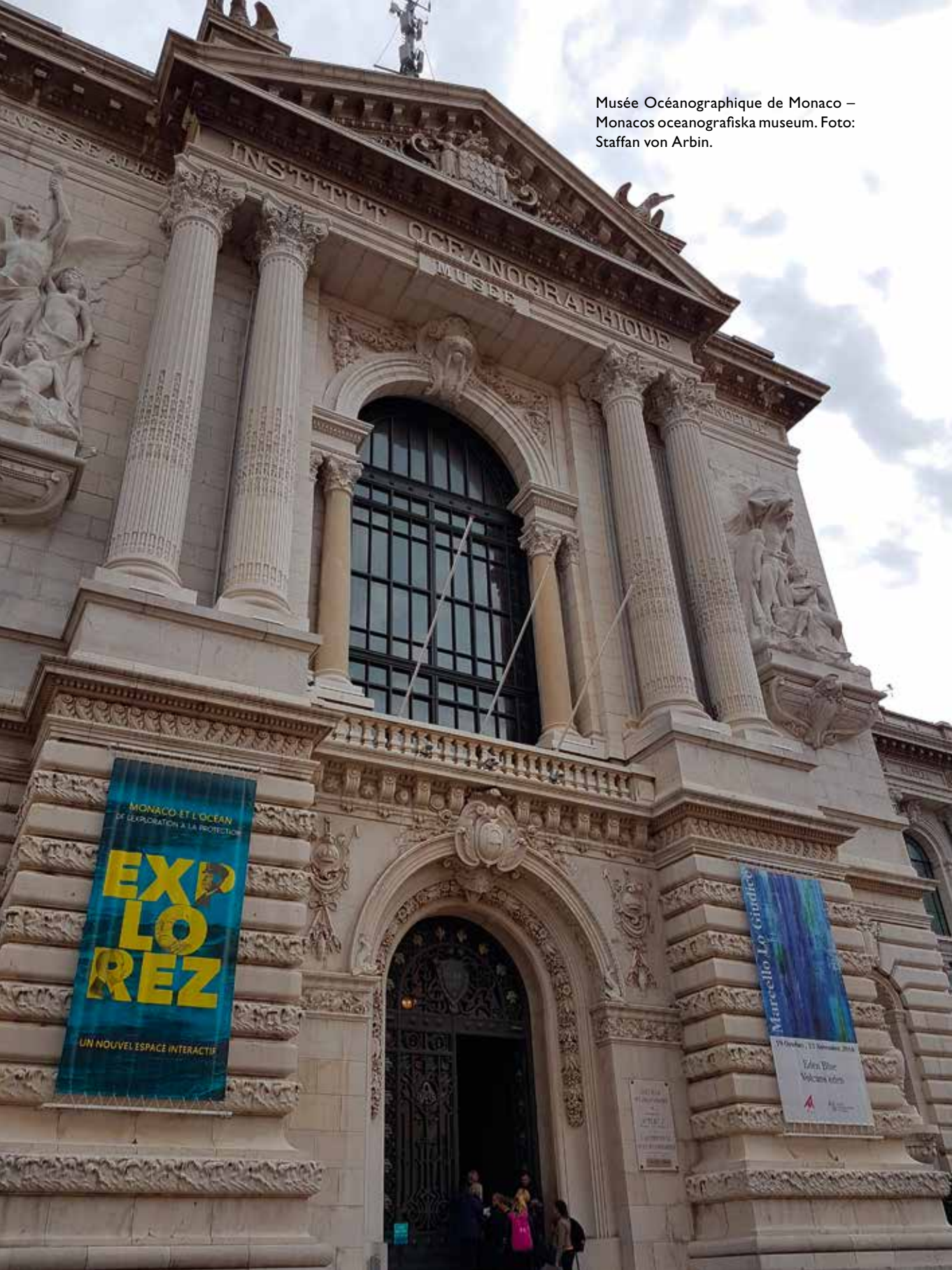
Musée Océanographique de Monaco – Monacos oceanografiska museum.

MONACO ET L'OCEAN DE L'EXPLORATION A LA PROTECTION EXPLORER UN NOUVEL ESPACE INTERACTIF