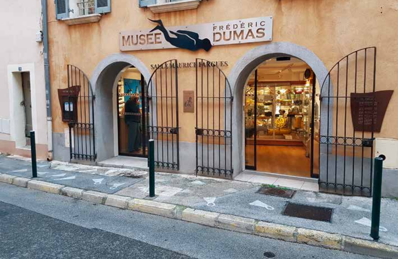
Det dykhistoriska museet Musée Frédéric Dumas i Sanary.