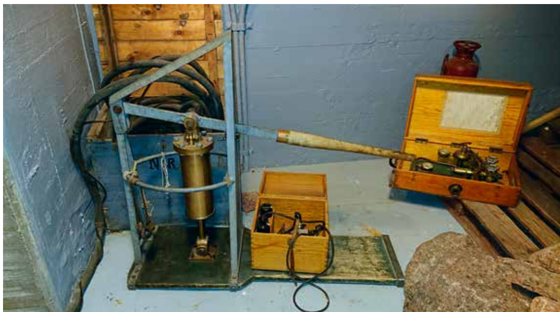
Med denna encylindriga luftpump från Emil Carlsson kan besökarna pumpa luft till dykarhjälm. Bredvid pumpen syns slanglåda, dyktelefon och slangdykarmanifold.