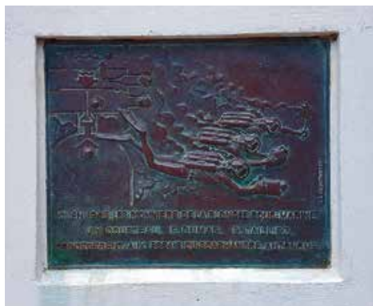
Minnesplakett som berättar om dykningen som skedde den 6 juni 1943.

För den dykhistoriskt intresserade är platsen väl värd ett besök. Den kan dock vara lite svår att hitta till, och även om Cousteau brukar anges som Frankrikes mest berömda person är det inte alldeles säkert att ortsborna kan ge nödvändig vägledning.