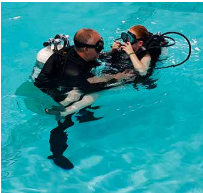
Jönköpings Dykarklubb Isopoda erbjöd prova på-dykning för de hugade.

Tyvärr har evenemangets besöksantal de senaste åren sjunkit drastiskt, vilket gör att Classic dykträff som enskild företeelse härmed upphör. Däremot välkomnar vi att bli inbjudna till andra evenemangsdagar på exempelvis Rosenlundsbadet. Kanske kan vi få se en fortsättning i Lysekil, med Föreningen Lysekils Dykmuseum som arrangör? Stort tack till alla som deltog och medverkade vid årets träff!