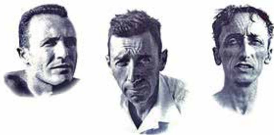
De tre havsmusketörerna Frédéric Dumas, Philippe Tailliez och Jacques-Yves Cousteau.

Efter en svår bilolycka med långvarig konvalescens, vilken ledde till att Cousteau fick lägga en i det närmaste avklarad pilotutbildning på is, tog han 1936 tjänst som artilleriofficer vid flottbasen i Toulon. Det var där han mötte Tailliez, som även han var officer. Dessutom var Tailliez sedan barnsben en hängiven simmare. Han föreslog därför att Cousteau skulle följa med honom och simma i havet som en del av sin rehabiliterings- träning. När Cousteau vid ett sådant tillfälle fick möjlighet att prova Tailliez hemmagjorda snorklingsutrustning förändrades hans liv i ett slag. Cousteau hade sedan de tidiga tonåren närt ett