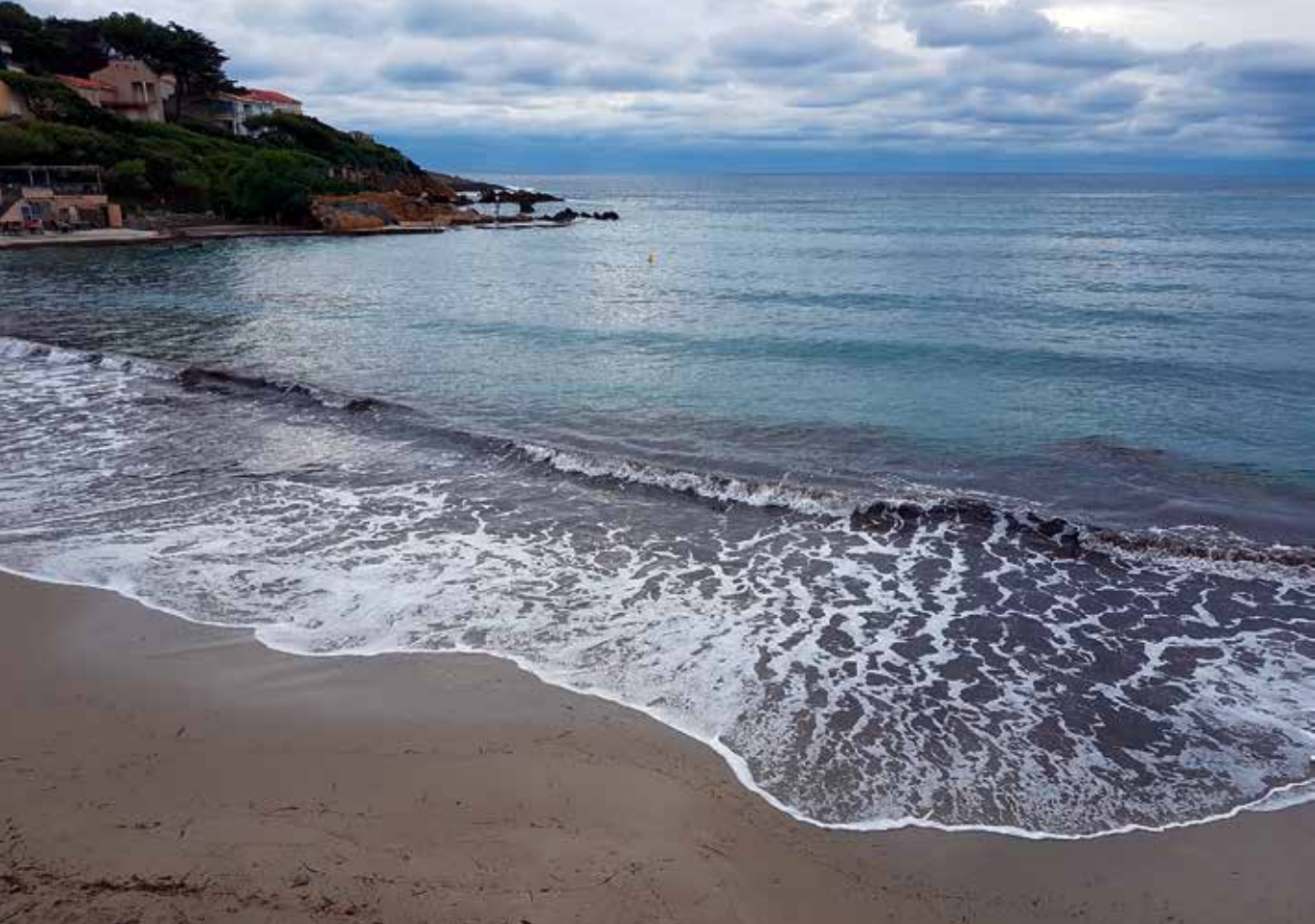
Plage de Portissol – stranden där Dumas brukade snorkla.