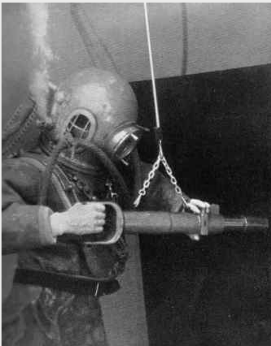
A diver using a Cox Submarine Bolt Driving & Punching Gun.

mander – on 21st June 1919 – ordered the scuttling of the entire fleet.