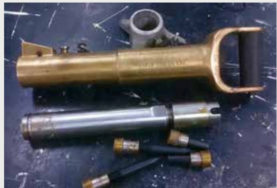
The Cox Submarine Bolt Driving & Punching Gun.

At the conclusion of WWI hostilities, the German High Seas Fleet was interned at the Royal Navy base at Scapa Flow, in the Orkney Islands of Scotland. On learning of the proposal to give the vessels to the victorious allies, the German com-