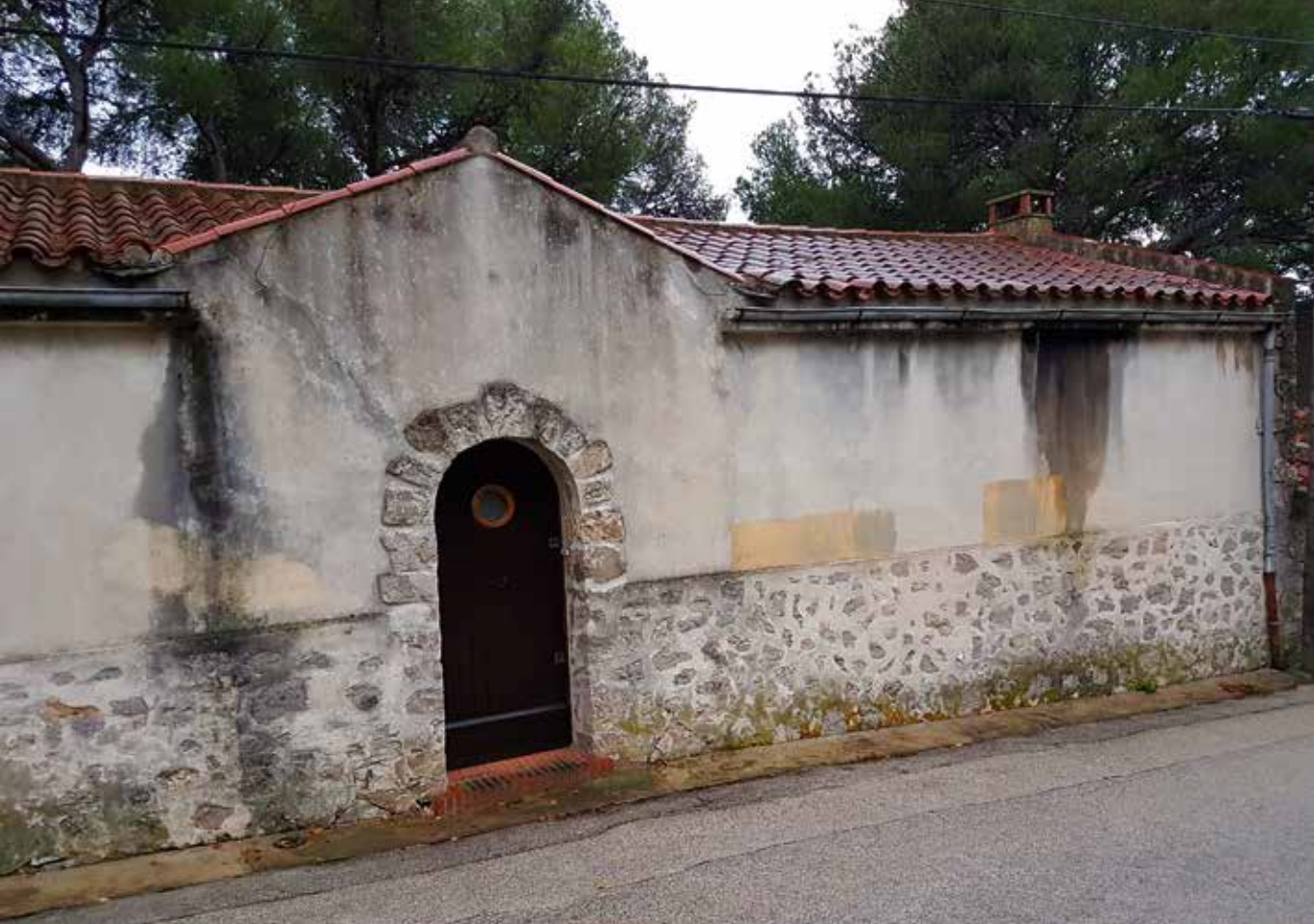
La villa Baobab var huset där Cousteau bodde i Sanary.