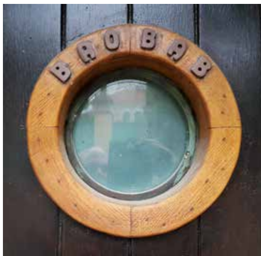
Fönstret som pryder ingången.

Det ligger på en höjd nära fiskehamnen, med utblick över Medelhavet, och är lätt att känna igen då en dörr ut mot den trånga gatan är försedd med ett runt fönster med texten Baobab på fönsterkarmen.