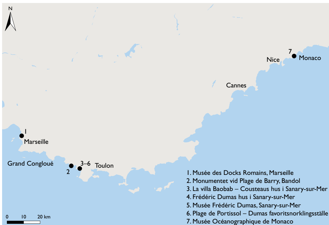
Karta över platser beskrivna i artikeln. Grafik: Anders Gutehall.

Min dykhistoriska resa tog sin början i Marseille, varifrån jag följde kustvägen österut. Slutmålet för resan var Monaco, en körsträcka på cirka 260 kilometer. I det följande tänkte jag redogöra för de platser med dykhistorisk anknytning som jag passade på att besöka under färden.