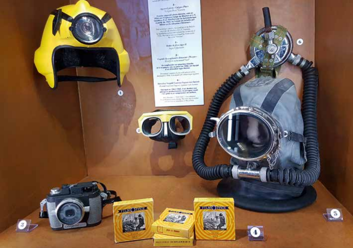
Några Cousteau-föremål i basutställningen på Musée Océanographique de Monaco.