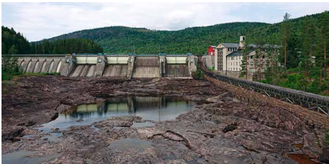
Vy från Krångede kraftverk. Museet ligger i anslutning till bebyggelsen till höger i bild.