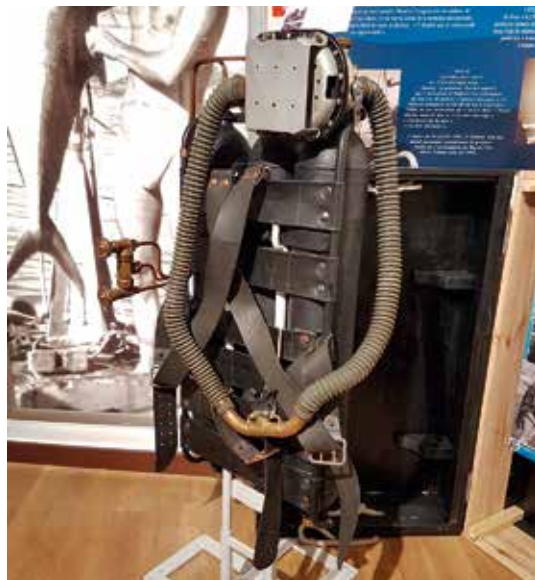
En tidig prototyp av Cousteaus och Gagnans "aqualunga" finns utställd i museet.

Många av föremålen är helt unika. Det gäller förstås inte minst Dumas personliga dykutrustning som finns till beskådan i museet. Bland annat visas en mycket tidig prototyp av Cousteaus och Gagnans "aqualunga".