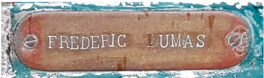
Fortfarande står namnet "Frederic Dumas" att läsa på brevlådan.

När man ser det känns det som att tiden nästan stått stilla. Fortfarande står namnet "Frédéric Dumas" att läsa på en handpräglad mässingsskylt som pryder den skamfilade brevlådan på staketet utanför huset.