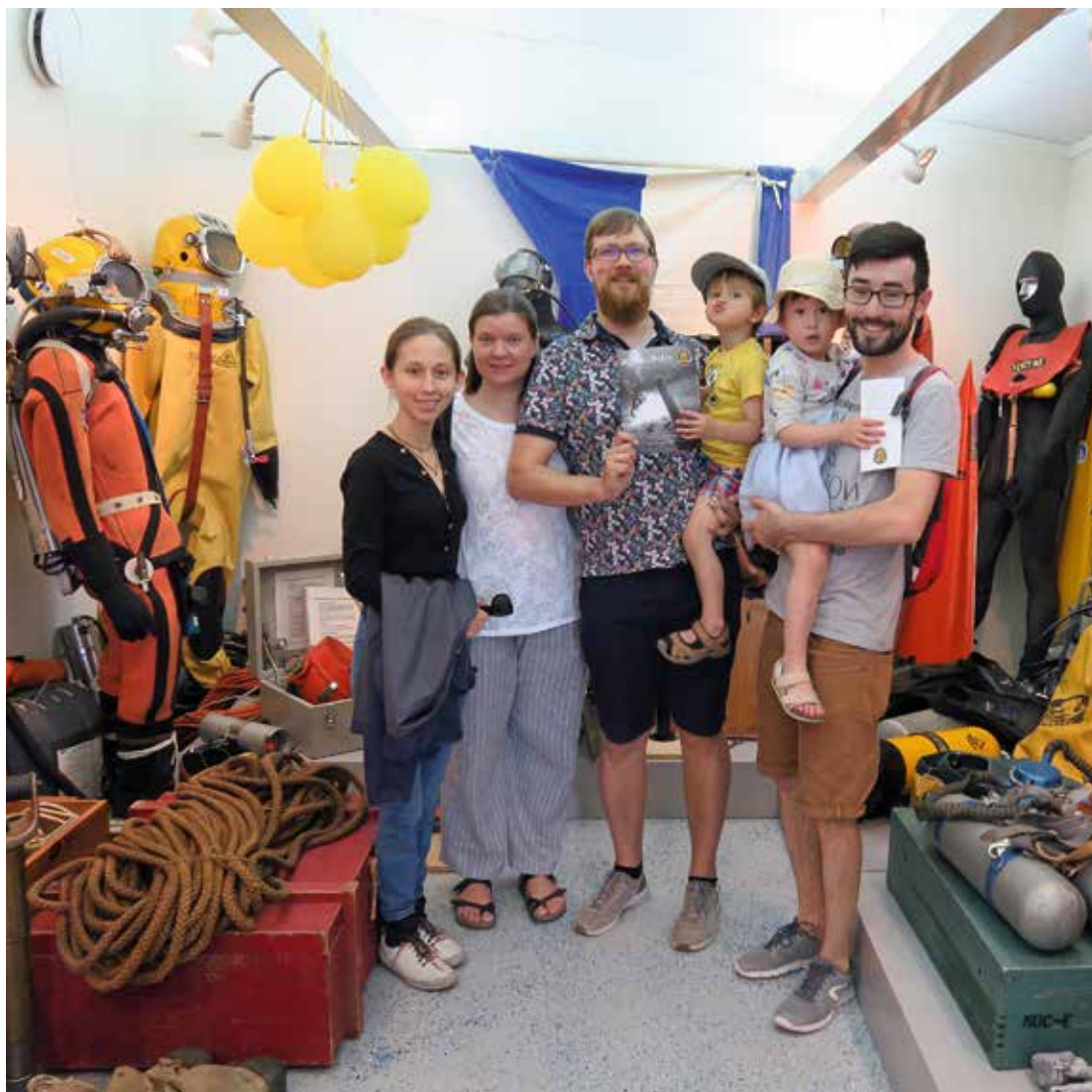
Fototips 4 Och naturligtvis en avslutande bild av nöjda besökare ...

finns kvar, de utställda objekten är i sitt rätta sammanhang. Att frivilliga och kunniga krafter driver verksamheten finner många också vara ett särskilt plus. De flesta är även imponerade av att få personlig guidning – och dessutom kostnadsfritt. Det är sällsynt i dagens museivärld.