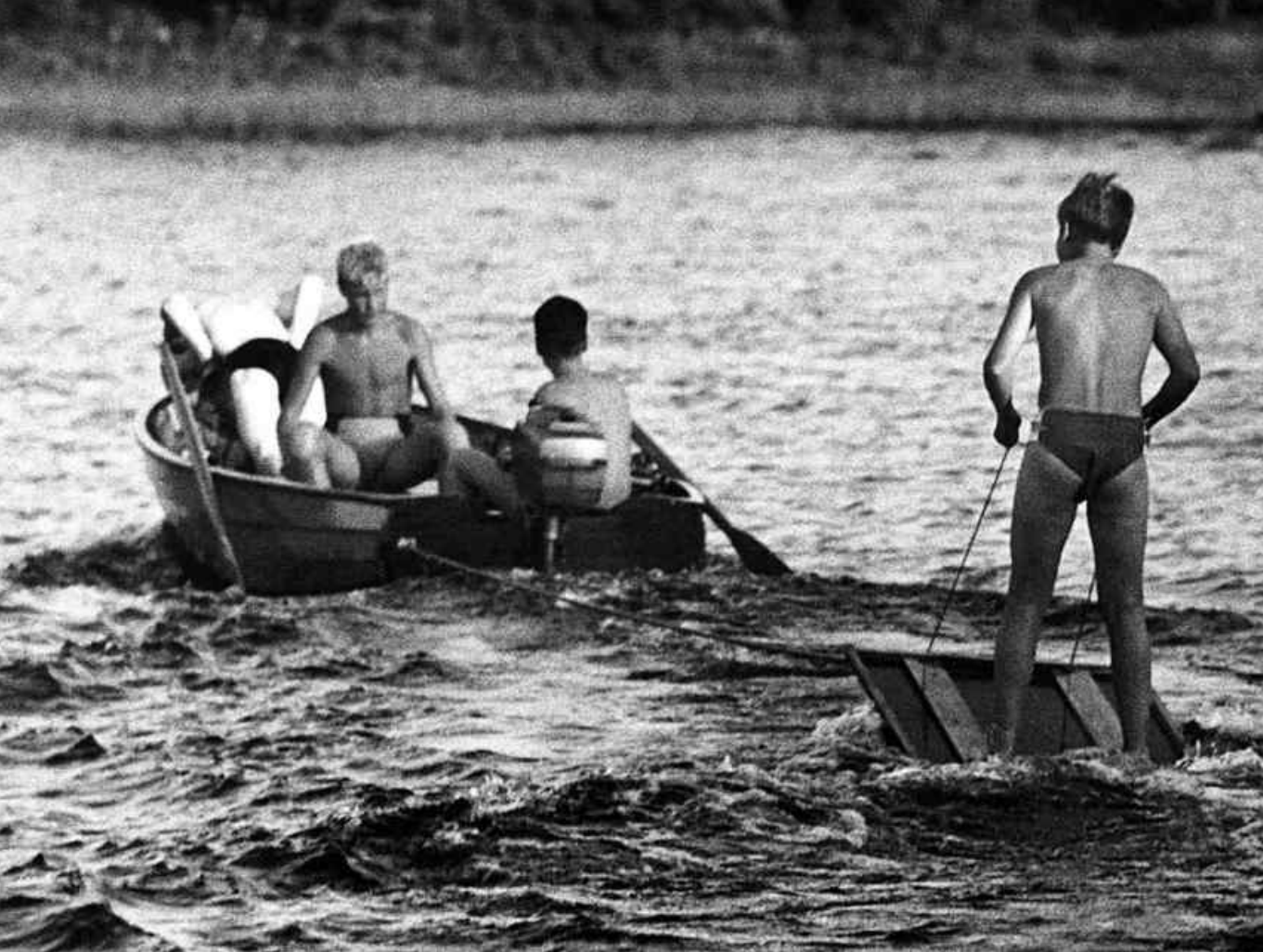
Gänget på nya äventyr. Hemsnickrad surfingbräda och en 5-hästars Pentamotor på "Äpplamosets" dykplattform.

monterades och kompletterades med en liten kulventil, en sådan som vi använde när vi pumpade fotbollar.