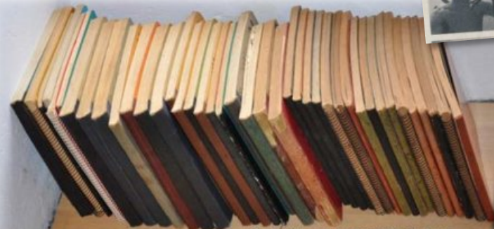
JOURNAL DE FRÉDÉRIC DUMAS